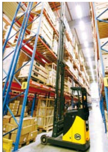
De moderne OM XR 16 ac reachtrucks zijn voorzien van een 360 graden stuursysteem en reiken tot 11,5 m stapelhoogte

DSV heeft gekozen voor een operationele lease, gecombineerd met een full service onderhoudscontract. Hierdoor zijn de kosten jaarlijks exact te budgetteren en heeft de gebruiker geen onaangename verrassingen. Daarnaast bestaat de mogelijkheid om na vijf jaar de trucks in eigen beheer over te nemen tegen een lage, afgeschreven restwaarde. Voor een deel van de vloot zijn bovendien speciale afspraken gemaakt voor eventuele tussentijdse omruil, indien het klantenbestand van DSV dit noodzakelijk mocht maken. Op deze wijze heeft DSV een uitermate flexibele beheersing van haar intern transportmateriaal.