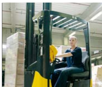
De chauffeurs bij DSV zijn erg enthousiast over de cabineruimte en het bedieningsgemak van de nieuwe reachtrucks

de pallets in het reachtruckmagazijn gebeurt met meer dan 40 stuks OM-reachtrucks van het type XR 16 ac, en het oudere model Thesi 16 / B2, die met 9.500 mm hefhoogte de bovenste afzetniveaus bereiken.