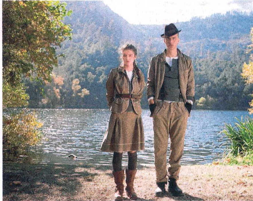
Der Förster vom Silberwald? Nein, die neue Mustang-Kollektion, die den Wandel vom reinen Jeans-Hersteller zum Lifestyle-Konzern dokumentieren soll.