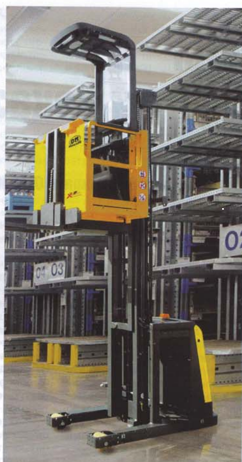
Вертикальные комплектовщики заказов OM серии ХОР

сти необходимую технику. Однако проблема заключается в том, что круг потребителей та-