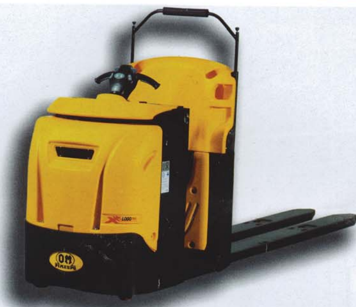
Горизонтальный комплектовщик заказов OM X LOGO

Комплектовщики заказов Otto Kurtbach созданы исключительно для выполнения своих прямых функций, в них нет лишних опций, но при этом все модели эргономичны, надёжны и позволяют существенно повысить товарооборот даже не-