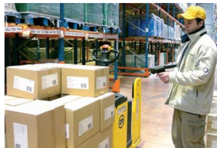
Распределение товара с помощью мобильного сканера штрихкода

Hupred является производителем сельскохозяйственных химикатов и производит чистящие, дезинфицирующие средства для сельского хозяйства, пищевой промышленности и автомобильной промышленности. Hupred экспортирует свою продукцию в более чем 45 стран мира на различных континентах, в т.ч. в Северную