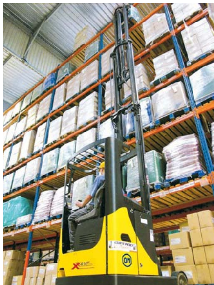
Ричтрак XRac поднимает груз на максимальную высоту в 6900 мм на складе Florendi Jardin (Groupe Roullier, Динар)

с отгрузкой паллет в производственной зоне, или в погрузке в фуры. TSX отлично зарекомендовали себя благодаря своему электрическому управлению, а также благодаря системе IntelliDrive – гидравлически стабилизируемому шасси, обеспечивающему стабильность даже на высоких скоростях.