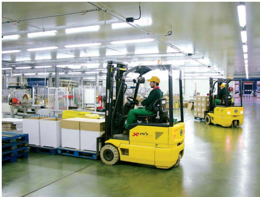
Электропогрузчик XE осуществляет отгрузку паллетированных продуктов на заводе Florendi Jardin