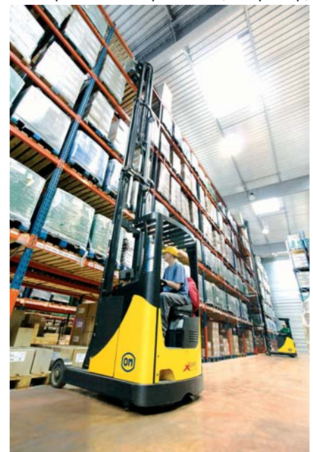
Ричтрак XRас загружает паллету на стеллажи на складе Florendi Jardin (Groupe Roullier, Динар)