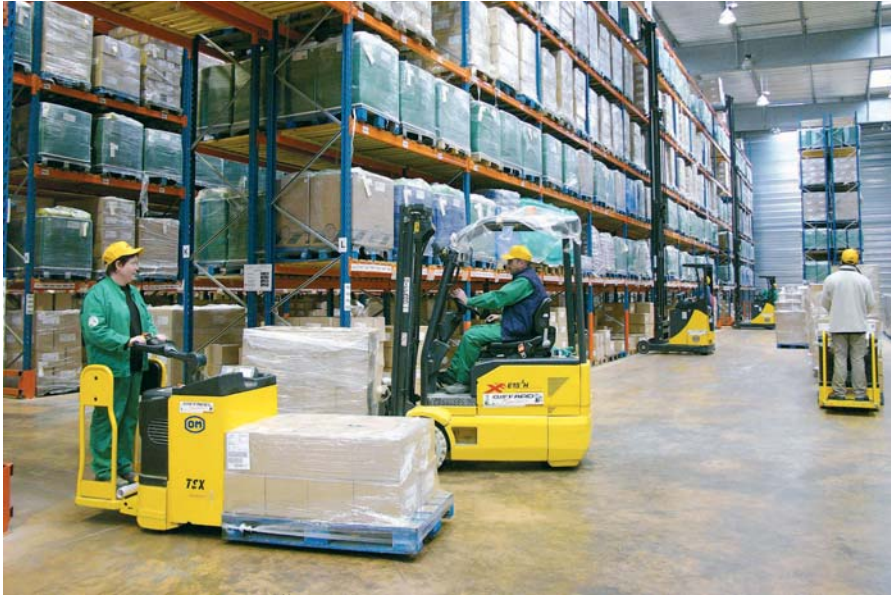
Парк складской техники марки OM на складе Florendi Jardin (Groupe Roullier, Динар)